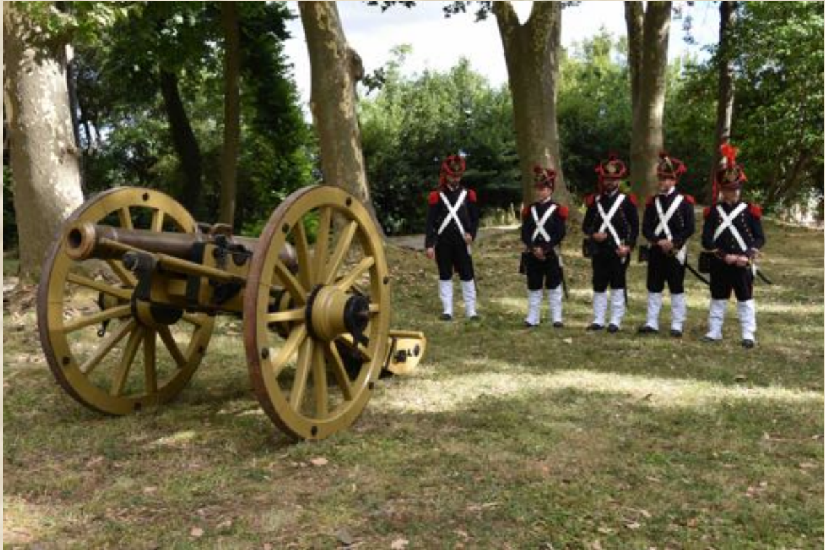
Le « Gribeauval » et ses servants