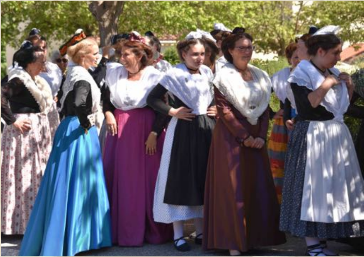
Arlésiennes et Gardians