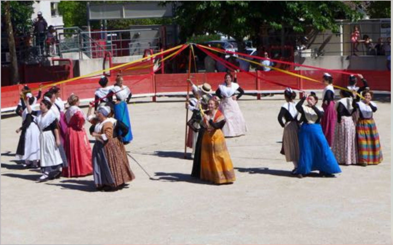
Dans les arènes